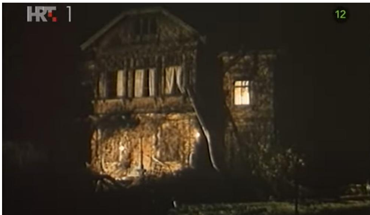
Fotografija 16. Sekina kuća – rupa bez dna 651

jer ne vjeruje da je itko u potpunosti moralan (8) 650 . U jednoj od posljednjih scena, prijateljica Tereza, inače Sašina supruga, naziva Branka i upozorava ga da hitno mora otputovati na neko vrijeme. Iako brzo stiže na aerodrom kako bi pobjegao u Frankfurt, zbog kašnjenja leta Vlado i milicajci/policajci dočekuju ga i odvođe u zatvor, bez njegovog opiranja.