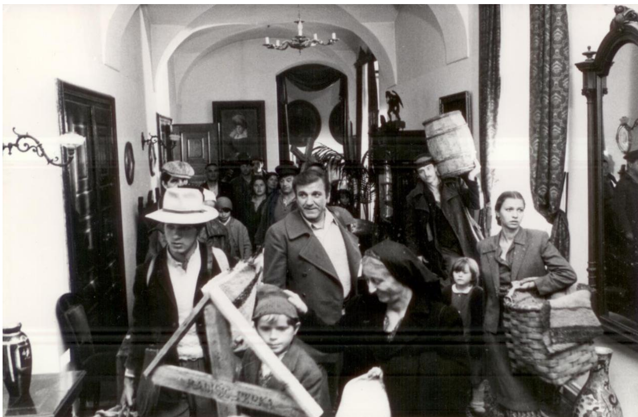
Fotografija 12. Dolazak dalmatinskih kolonista u „obećanu zemlju“ 600

Miliša se protivi ulasku u zadrugu jer koncepciju zajedničkoga vlasništva smatra nepravednom ( Ja nešto steknem svojim znojem i žuljima, a ti mi to otmeš da bi ranija neradnike i linčine. ), dok Markan naivno smatra da je u tome budućnost ( Kolektivizacija će zahvatit Ameriku i cili svit! ). Milicijski načelnik svjestan je da prijelaz u zadrugu neće biti jednostavan zadatak, stoga očekuje od Markana, koji je partijski poslušnik, da ih rigoroznim metodama natjera na ulazak u zadrugu ( Pritegni ih malo, čovječe! Nametni im takav otkup kakav neće moći izdržati! Nađi kolovođe! ).