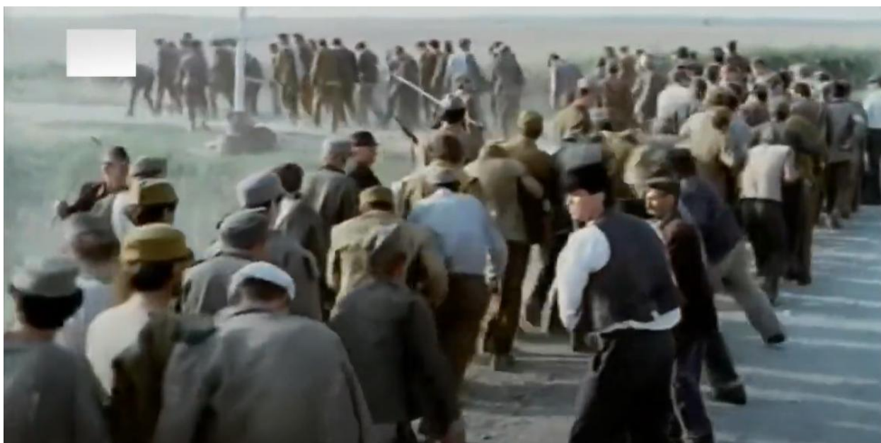
Fotografija 7. Križni put partizanskih zarobljenika 554