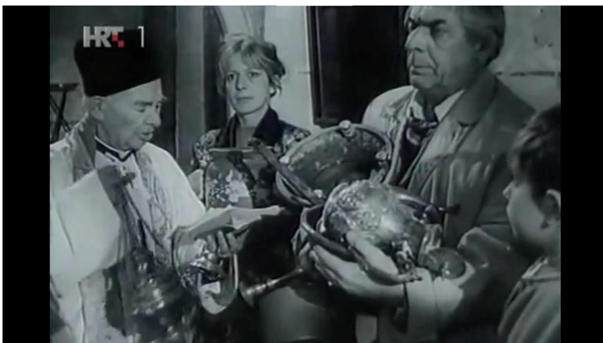
Fotografija 13. Sveta tri kralja donose mirise, zlato i tamjan 622

Dragin odlazak u Zagreb nije bio motiviran samo susretom s djecom nego i željom za novim početkom te nekom svjetlijom budućnosti ( Sve je bilo lako izdržati dok je bilo nade u povratak. ). Međutim, dolazak Sveta tri kralja ( Fotografija 13. ) 621 i Madonina velika nužda u skupocjenom vrču opet unose ravnotežu u njihov život ( Ah, trebamo je. Trebamo je da bismo preživjeli od jedne do druge njene stolice, između dva sranja, onog tamo gore i ovog ovdje. ) te postaju svjesni da je to sr*** daleko manje od onoga u koje ih je surovo uvukao socijalizam.