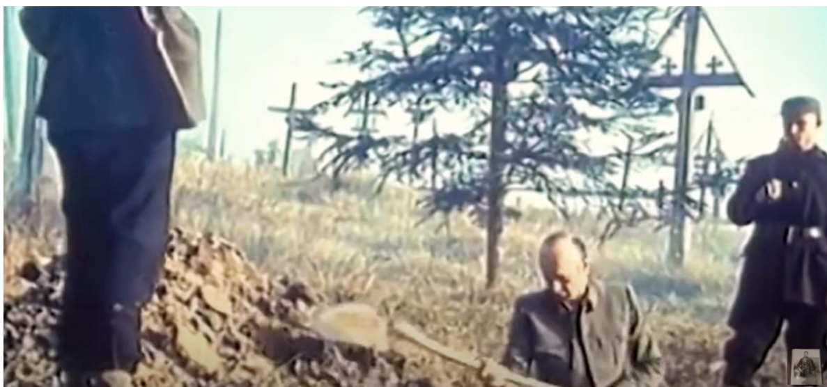
Fotografija 8. Oficir kopa svoj grob prije strijeljanja 561

Možda se u tome kriju Dikanova okrutnost i nepopustljivost kada konačno zarobi bjegunca s početka filma – domobranskog oficira, Srbina i hrvatskoga zeta, zbog čega Dikan preispituje njegovo djelovanje s pozicije nacionalno (ne)moralnog. Oficir, u razgovoru s Ivanom i Dikanom, pokušava objasniti da je odabir njima neprijateljske strane zapravo uvjetovan strahom za suprugu i djecu, čije intimno pismo nosi u grudima. Osim toga, iz njegove je perspektive odnos mi – oni dijametralno suprotan od onoga koji zagovaraju partizani (9) 560 što je potvrda da je svaka ideologija na neki način isključiva i polazi od uvjerenja da je jedino ona ispravna. Usprkos oficirovoj iskrenosti i Dikanovoj svijesti (iako nije verbalizirana) da zapravo i nisu toliko različiti, Dikan zapovijeda oficiru da si sam iskopa grob, iznad kojega ga potom ustrijeli ( Fotografija 8. ).