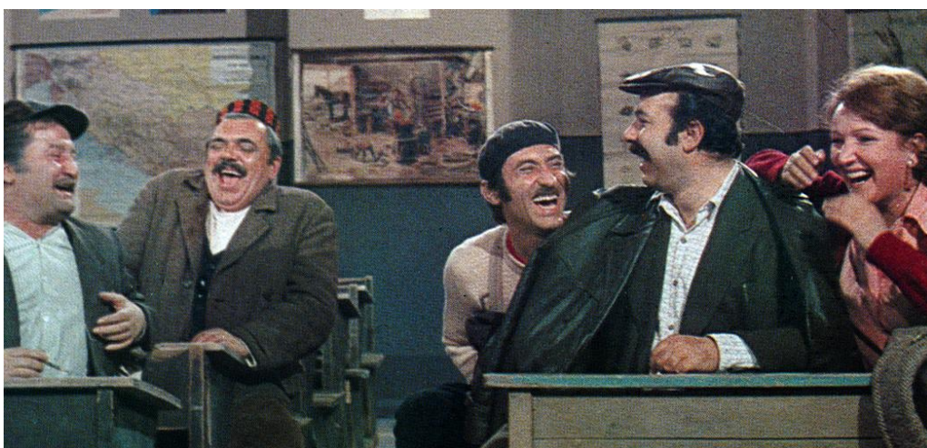
Fotografija 14. Podjela dramskih uloga seljanima iz Mrduše Donje 627

predstavu, a kako je narod nepismen, u tome bi im trebao pomoći učitelj kojemu se ne sviđa ta ideja, budući da je svjestan s kim ima posla ( E, moj Šimurina! Da ti znaš koliko bi bija zaslužan za kulturu da nisi išo baš u Zagreb vino prodat. ). Ipak, pritisnut političkim ucjenama, nabavlja djelo i nekolicini važnijih ljudi u zadruzi dodjeljuje uloge ( Fotografija 14. ). Čini se da je čitanje teksta prevelik zalogaj za Bukaru ( Ajd u Božju mater i on i ko mu je da pero u ruke! To je nika budalina! ) pa je učitelj prisiljen prilagoditi slavno djelo nepismenim glumcima. Iako utjehu pronalazi u alkoholu, korekcijom djela postiže zapanjujuću i realnu karakterizaciju Bukare/Hamletovog strica (10) 625 i Joce/Hamleta (11) 626 čega je i sâm svjestan ( Sve je tako daleko od Shakespearea... a i blizu. ).