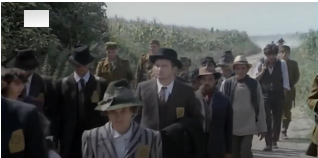
Fotografija 6. Križni put ustaških zarobljenika 553

promijeniti i ratna sreća te će partizani nadvladati ustaše, u sredini filma ponovno će se pojaviti ovaj motiv, no sada u zamijenjenim ulogama – partizani će predvoditi kolonu zarobljenih ustaša i svih onih koje su optužili za kontrarevoluciju ( Fotografija 7. ), također u cilju ubijanja.