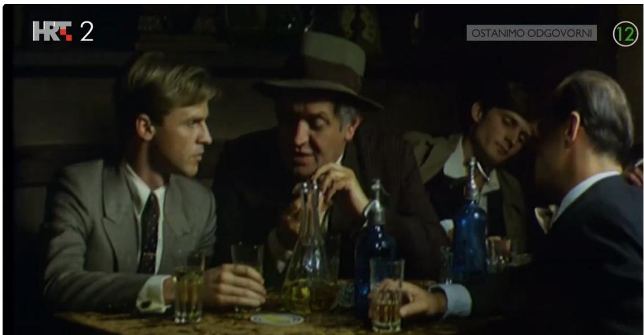
Fotografija 5. Stalni gosti „Dajdama“ 549

U ovom modelu polazimo od tvrdnje da je iz gore navedenih i kronološki poredanih triju filmova moguće iščitati snažan antiratni stav u smislu protivljenja bilo kojoj ideologiji. S obzirom da se sva tri filma radnjom referiraju na Drugi svjetski rat, protivljenje je iskazano u odnosu na fašizam i socijalizam, bez obzira na pojedine likove koji su zagovornici jedne ili druge ideologije. Iako smo filmove poredali s obzirom na vrijeme nastanka, krenut ćemo od Kiklopa (1982.) jer, iako se u svijetu naveliko ratuje, Zagreb još uvijek iščekuje rat. Sve je obilježeno psihozom koja je dodatno naglašena stalnim radijskim izvještajima o potezima i napredovanjima velikih europskih sila ili razgovorima o ratu u urbanim javnim prostorima, u kojima se ponekad prognozira pobjeda jedne ili druge strane. Bez sumnje, rat je pred vratima Kraljevine Jugoslavije, a toga je svjestan i Melkior Tresić, vrlo senzibilan intelektualac i dramski kritičar čije stalno društvo čine stariji novinar Maestro, duhoviti i kronični alkoholičar Ugo te intelektualac don Fernando, odnosno vjerni gosti gostionice „Dajdam“ ( Fotografija 5. ).