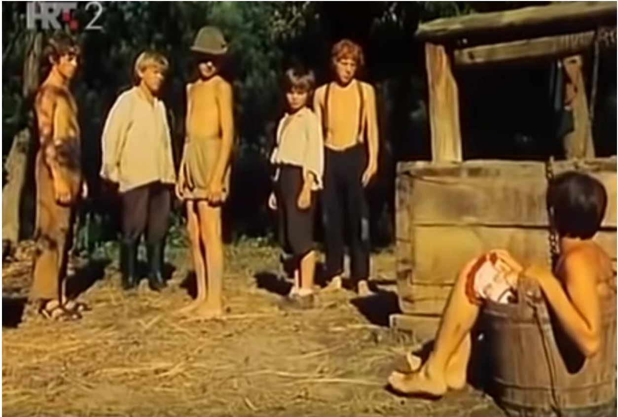
Fotografija 1. Priprema za čišćenje staroga bunara 507

svoj život svjesnim sjedanjem u čabar za potrebe čišćenja bunara, iako se Medo prethodno onesvijestio od otrovnih plinova iznutra ( Fotografija 1. ).