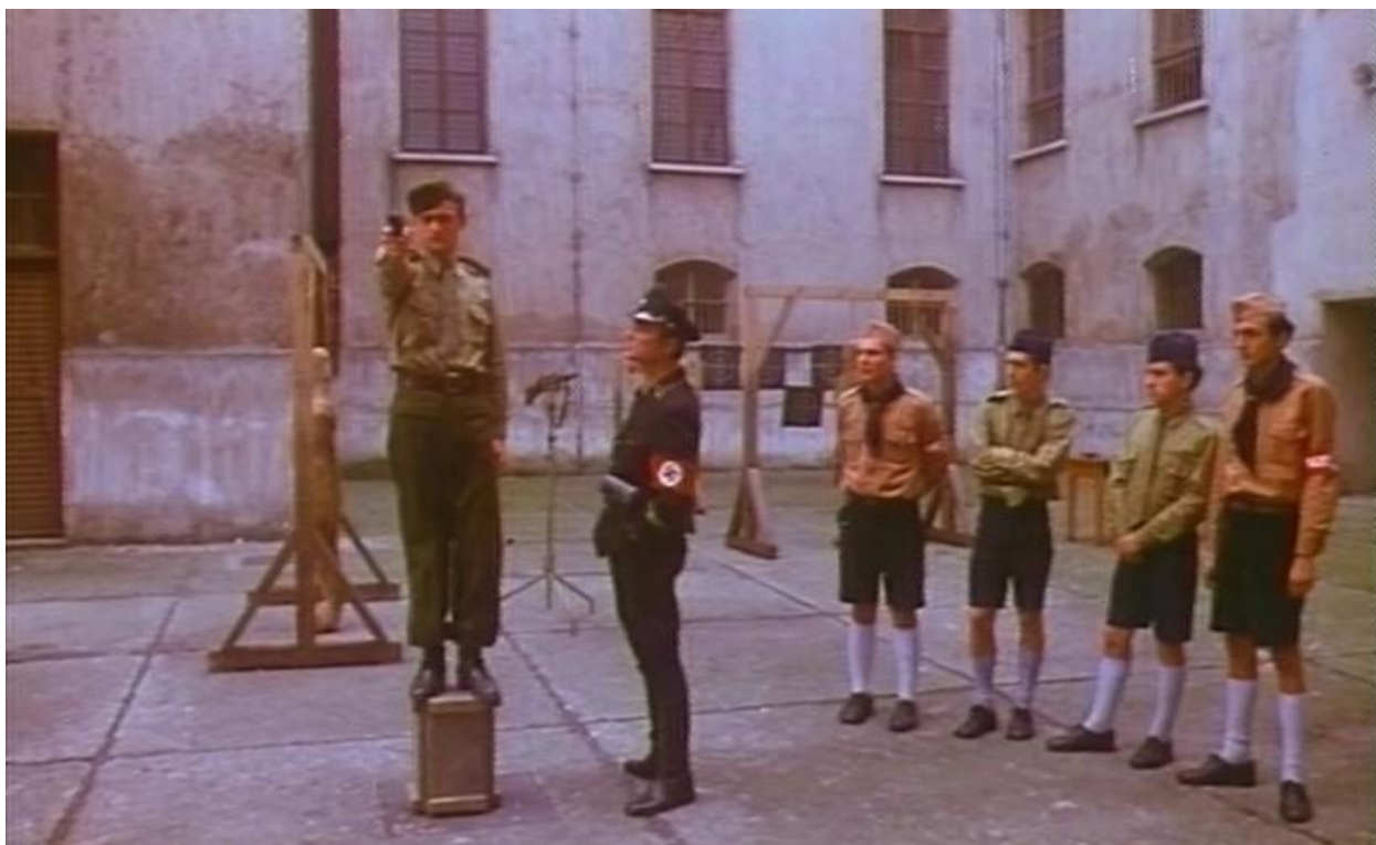
Fotografija 3. Školsko dvorište kao prostor za vojnu obuku ustaške mladeži 532

Ferkovo je ponašanje posve u skladu s očekivanjima hrvatske fašističke vlasti koja, u organizaciji nastavnika Verdara, povjerenika za prosvjeđivanje, organizira okupljanje mladeži na stadionu. Poštujući novi poredak, čije je temelje udario Hitler, Verdar se svečano obraća srednjoškolcima i ističe da će živjeti i raditi po uzoru na Hitlerovu mladež ( Hitlerjugend ), no prvo moraju odstraniti raso i nacionalno nepoželjne pojedince (5) 533 . Vijore se nacističke i ustaške