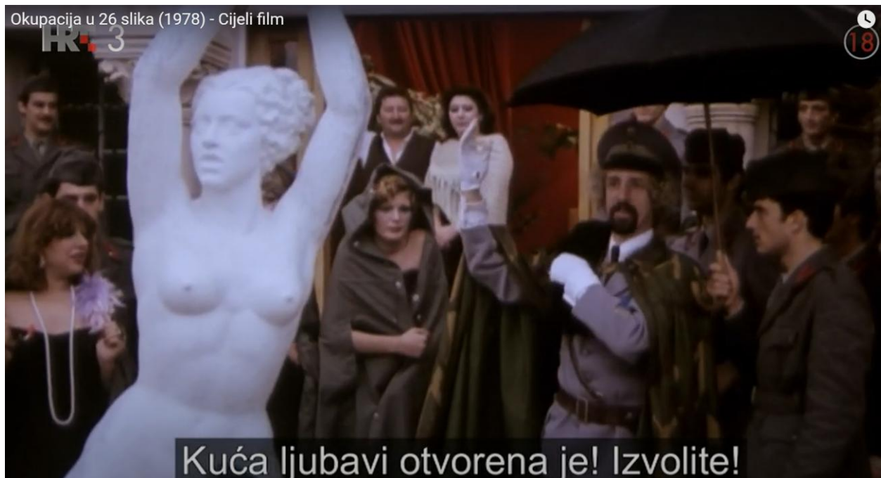
Fotografija 4. Dolazak fašista i prostitutki u „kuću ljubavi“ 537

služi drugome, osim rađanju potomaka (7) 536 i zadovoljavanju potreba herojskih fašističkih muškaraca, koji su spremni poginuti za svoje ideale. Scene fizičkog orgijanja mogu se protumačiti kao orgijanje nad kulturom okupiranoga stanovništva, odnosno kao dekadencija i kulture i morala.